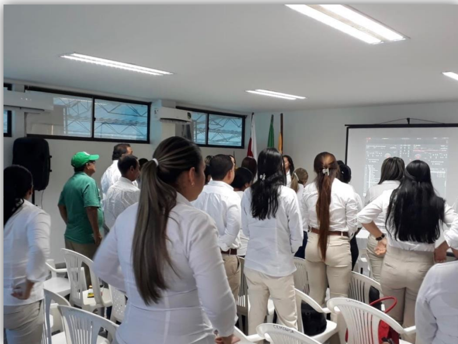
Puesto de salud CDB, día 27 de Febrero de 2019.